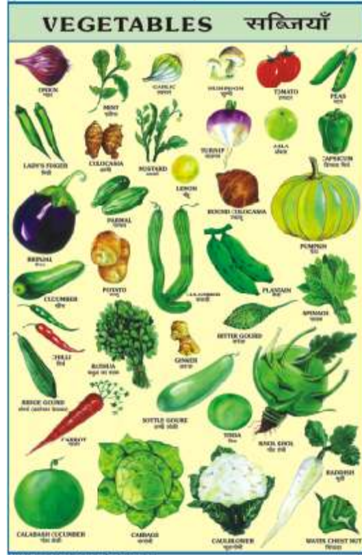
CC05 : Vegetables