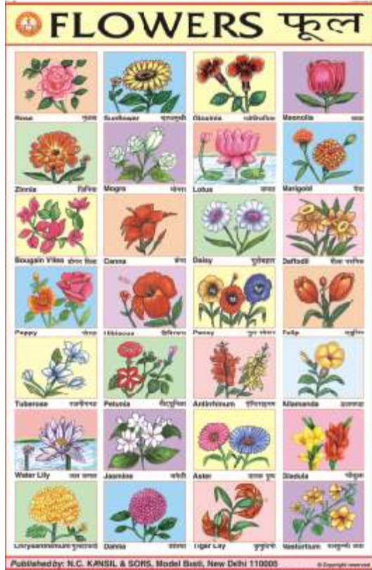
CC08 : Flowers