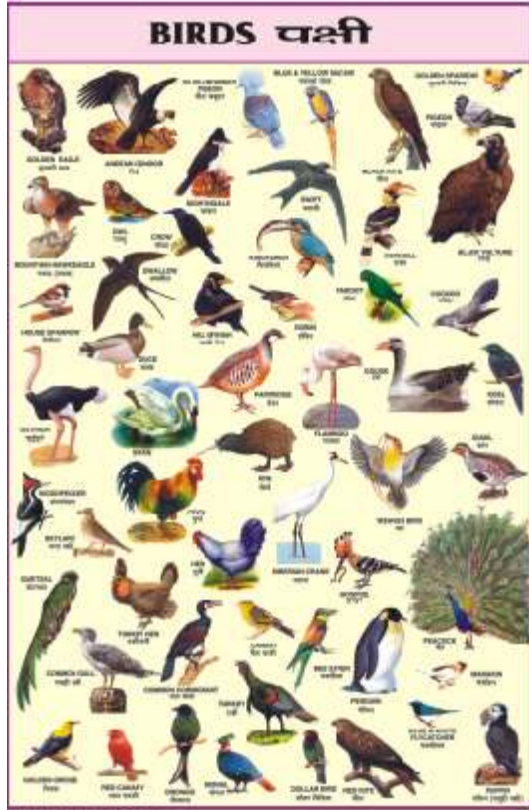
CC03 : Birds