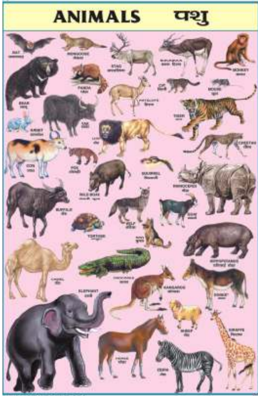
CC01 : Animals