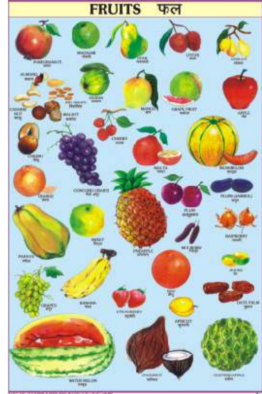
CC06 : Fruits